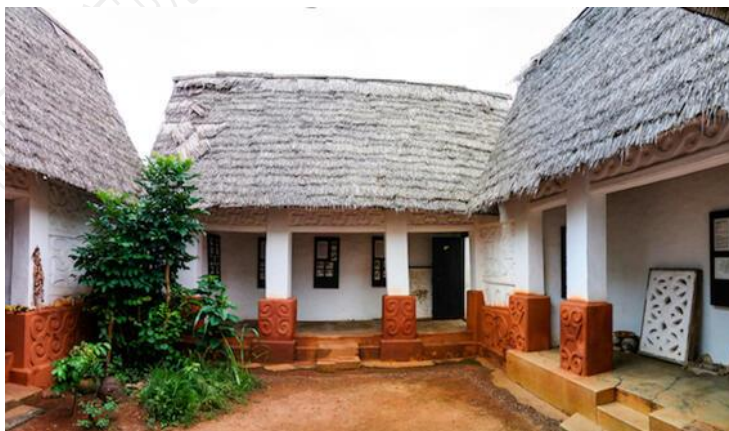
加纳阿散蒂古城，图片来源：世界古迹基金会网站

统建造工艺逐渐流失。在美国驻加纳大使馆和美国国务院的支持下，世界古迹基金会考察了阿散蒂传统建筑，对其建筑保存状况进行了评估，并将考察内容发布于《2012年世界古迹观察》（2012 World Monuments Watch），通过宣传提高公众对古城的保护意识。