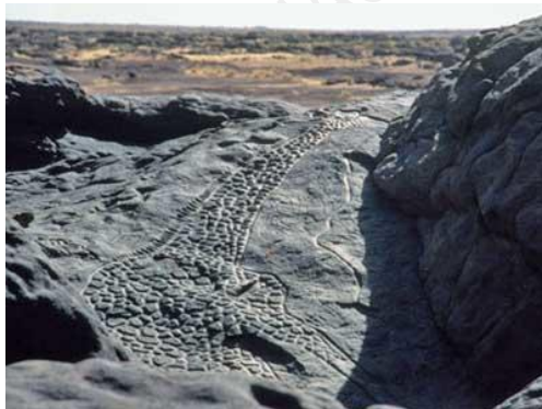
尼日尔长颈鹿岩画艺术，图片来源：世界古迹基金会网站

教育和培训是实现文化遗产可持续发展的重要环节，这一点在世界古迹基金会的非洲项目中得到充分体现。撒哈拉沙漠的岩石艺术一直被视为当地独特文化、科学和历史的象征，但是在尼日尔的阿加德兹（Agadez）似乎并未受到重视。为此，世界古迹基金会在当地改进了标牌，提醒游客尊重岩石艺术，避免破坏石刻。此后，美国运通公司也参与支持该项目，通过建设人行道和其他旅游设施减少行人对岩石艺术的破坏。此外，在布基纳法索，由于当地没有法定的遗产保护程序，且缺乏现代建筑保护知识，加之开发商对其周围地段的过度开发，被誉为非洲最重要的现代主义建筑典范之一的民众之家（La Maison du Peuple）的维修工作被长期拖延。2022年该遗址被列入世界古迹观察名单后，世界古迹基金会计划将可持续保护和再利用的重点落脚于培训当地建筑专业的学生和专业人士，并向他们提供必要的工具和技术支持，以实现对此类现代主义建筑的评估和保护。基金会还计划与瓦加杜古大学以及其他社会组织合作，通过建立口述历史和数字档案，增强专业建筑人士、当地政府、学校及本地居民对该遗址的认识。