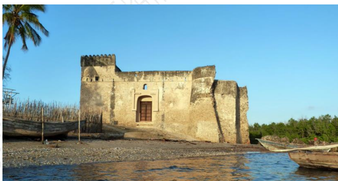
坦桑尼亚基尔瓦遗址

赠款一直是世界古迹基金会激发当地增强建设和保护能力的重要手段。坦桑尼亚的基尔瓦（Kilwa）遗址和松戈马拉（Songo Mnara）遗址联合项目曾经一次性获得 70 万美元资助，这笔钱来自美国大使文化保护基金对世界古迹基金会非洲项目的资助，且是其中数额最大的一笔。由于当地气候条件的影响，上述两处遗址在不同程度上遭到破坏，自 2011 年起，得益于这笔资金，不仅当地建筑物和废墟受到保护，而且海岸侵蚀的伤害也减少。此外，这笔资助还改善了人居环境，为松戈马拉建造了水库，保障该岛淡水的定期供应，完善了旅游基础设施等。 3 由于保护工作确有成效，2014 年联合国教科文组织将两处遗址从拟定的濒危世界名录中移除。